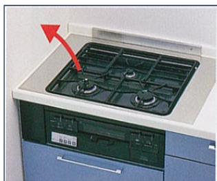
既設コンロを引き上げます