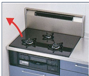
既設コンロを引き上げます