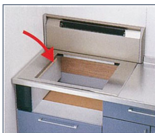
コンロ取替アダプターを設置します