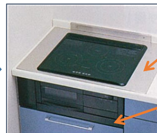
お取替えコンロを設置します