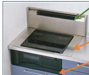
お取替えコンロを設置します