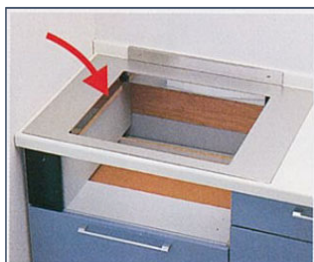
コンロ取替アダプターを設置します