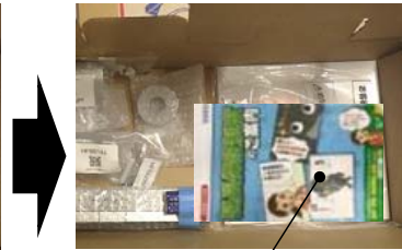
延長保証ご案内ちらし