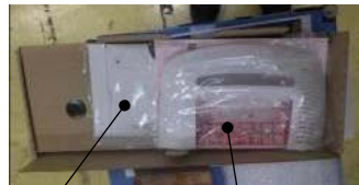
背面カバー 注意書