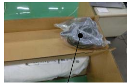
排水ソケット(ユニット)